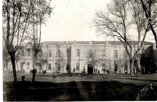
Türk İnkılâp Tarihi Enstitüsü (TİTE) Arşivi, FK.28, G. 99, B. 99 001.