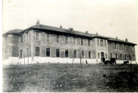
Türk İnkılâp Tarihi Enstitüsü (TİTE) Arşivi, FK.28, G. 67, B. 67 001.