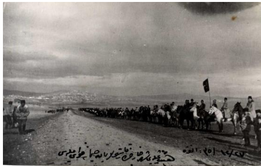
Türk İnkılâp Tarihi Enstitüsü (TİTE) Arşivi, FK. 36, G. 26, B. 26 001.