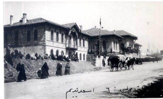
Türk İnkılâp Tarihi Enstitüsü (TİTE) Arşivi, FK.48, G. 18, B. 18 001.