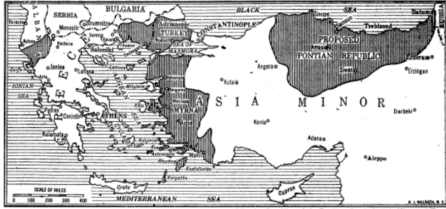
GREEK MAJOR AND MINOR CLAIMS AT PARIS—Showing the Proposed Pontian Republic and the Territory Sought in Asia Minor and Europe.