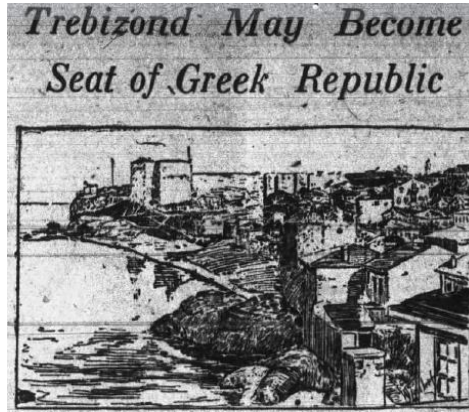
Ek 5. Daily Arcansas Gazette, 29 Nisan,1919

Araştırmacıların Katkı Oranı Beyanı: Yazarlar makaleye eşit oranda katkı sağlamış olduklarını beyan eder.