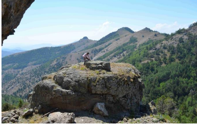
Resim 10. Gâvur Kalesi Yerleşimi

Çalışmalarımız daha sonra Tepeköy köyü sınırları içerisinde devam etmiştir. Tepeköy köyünün yaklaşık 8 km. kuzeyinde doğal bir tepenin güneybatı yamacında, tepe noktasına yakın yerde kayalık bir alanda Gâvur Kalesi olarak adlandırılan bir yerleşim tespit edilmiştir.