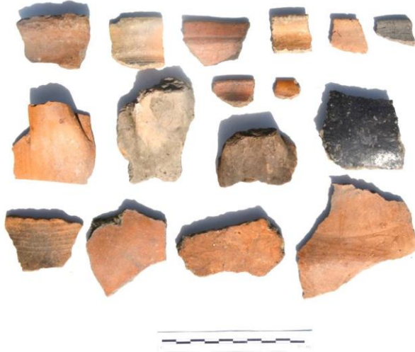
Resim 17. Hönker Kalesi ETÇ-II. Binyıl Keramik Örnekleri

Dağlık kesimindeki çalışmalarımıza Alucra ilçe merkezi yakınlarındaki Şök Puarı mevki incelenerek devam edilmiştir. Bu alanın daha önceden kilise mevki olarak adlandırıldığı bilgisine de ulaşılmıştır. Alucra ilçe merkezinin 1,5 km kuzeyinde, Alucra-Şiran yolunun 500 m kuzeyinde bulunan yerleşim Alucra-Koman köyü yolunun hemen batısındadır. Yayılım alanı geniş olan Şök Puarı yerleşiminde bazı kaçak kazı çukurlarında mimari duvar kalıntıları görülmüştür. Tek evreli bir yerleşim olduğu düşünülen yerleşimde zayıf oranda amorf II. Binyıl keramiği ve az miktarda atölye artıklarına (cüruf) rastlanmıştır.