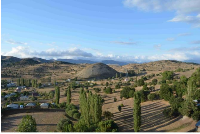
Resim 3. Aktepe Yerleşimi ETÇ-II. Binyıl Keramik Örnekleri

Bu çalışmalar tamamlandıktan sonra çalışmalarımız ilçenin doğusunda Alucra-Şiran karayolu üzerinde yoğunlaşmıştır. Burada Han Tepesi Höyük tespit edilmiştir. 12