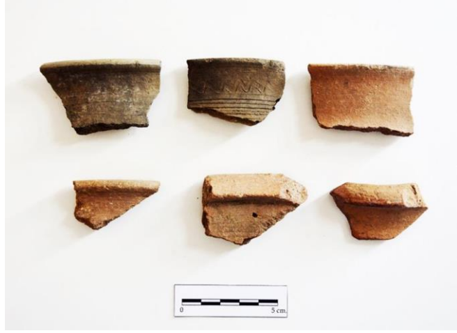
Resim 5. Han Tepesi Höyük II. Binyıl Keramik Örnekleri