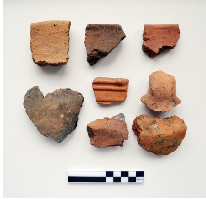
Resim 13. Kaleyeri/Kalecik ETÇ-II. Binyıl Keramik Örnekleri

Kuzeybatı-güneydoğu yaklaşık 160 m güneybatı-kuzeydoğu uzantısı ise yaklaşık 50 m dir. Alucra Elmacık köyü yolunun 300 m doğusunda, Elmacık köyünün ise 1 km güneydoğusunda, Uzun çayır deresinin hemen 300 m doğusundadır. Yerleşme üstünde ETÇ ve II. binyıl keramik parçaları tespit edilmiştir. 19