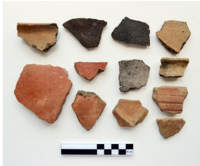
Resim 2. Aktepe Yerleşimi ETÇ-II. Binyıl Keramik Örnekleri

Yine Aktepe köyü sınırları içinde bulunan Aktepe Yerleşmesi, Alucra-Şebinkarahisar bağlantı yolunun hemen batısında bulunmaktadır. KD-GB 150 m, KB-GD 50 m olan tepe üzerinde keramik görülmeyen alanın yamaçlarında ETÇ ve II. Binyıla ait keramik parçaları tespit edilmiştir. Yol güzergahı üzerinde bulunan ve ova içerisinde hâkim bir noktada doğu-batı uzantılı geçiş yolunu denetleyen yerleşmenin yayılım alanı tam olarak belirlenememiştir.