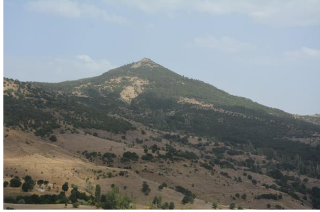
Resim 16. Hönker Kalesi

Hönker Kalesi Giresun-Gümüşhane il sınırı üzerinde 20 yer almaktadır. Alan Köklüce köyünün yaklaşık 4 km kuzey doğusunda, Şiran-Alucra karayolunun yaklaşık olarak 5 km güney doğusundadır. Alanda yapılan incelemede tepeyi tamamen çevrelediği düşünülen sur duvarına ait kalıntılar dikkat çekmektedir. Kalenin içinde de duvar kalıntıları bulunmaktadır. Kalenin kurulduğu tepenin yamaç ve eteklerinde bol miktarda mimari taş parçalarının olması, kaledeki yerleşimin burada devam ettiğini düşündürmektedir.