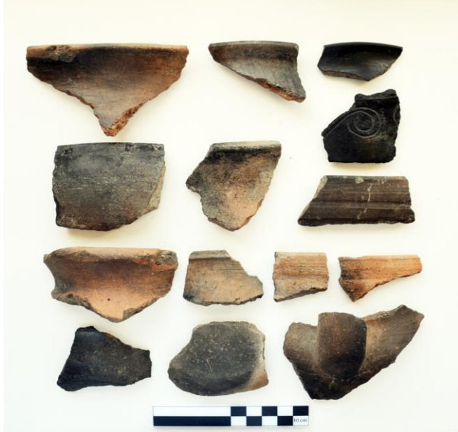
Resim 11. Gâvur Kalesi GKÇ- ETÇ (Karaz) Keramik Örnekleri

Ana kaya ile sınırlanmış 20x20 m. boyutlarında bir tepe üstü yerleşimi olan alan kaçak kazılarla tahrip edilmiştir. Kaçak kazıdan çıkan molozların içinde bulunan keramik parçaları GKÇ-ETÇ, II. binyıl dönemlerine tarihlenmişlerdir. Bu alanda az miktarda Karaz kültürüne ait keramikler de tespit edilmiştir. 17