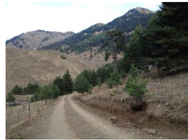
Resim 9. Salıncak Kaya Nekropolü