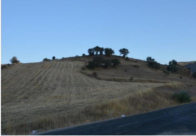
Resim 4. Han Tepesi Höyük

Bu çalışmalar tamamlandıktan sonra çalışmalarımız ilçenin doğusunda Alucra-Şiran karayolu üzerinde yoğunlaşmıştır. Burada Han Tepesi Höyük tespit edilmiştir. 12