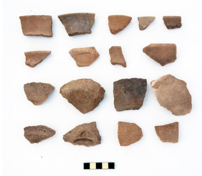
Resim 6. Han Tepesi Höyük ETÇ-II. Binyıl Keramik Örnekleri

Höyük kabaca doğu-batı yönlü 300 m. kuzey-güney yönlü 200 m. ölçülerindedir. Yüzye yoğun olarak çatı kiremiti ve taş mimari parçalar tespit edilmiştir. Kiremitlerin üstü parmakla yapılmış üçgen oluk bezemelidir.