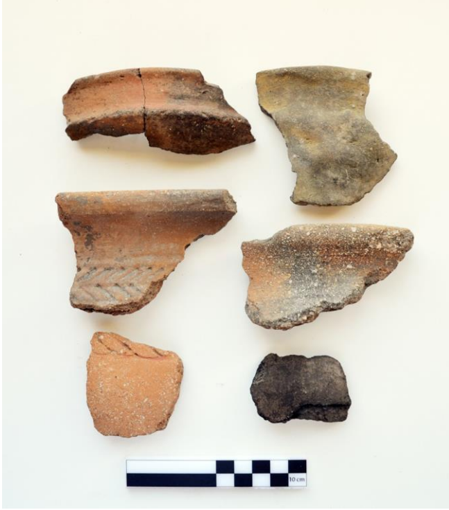
Resim 15. Topalaksağ Yerleşimi ETÇ-II. Binyıl Keramik Örnekleri

Doğal kaya üzerinde ve üstünde ETÇ ve II. Binyıl ait keramikleri tespit edilmiştir. Yerleşme Giresun-Gümüşhane sınırında olup hâkim bir tepedir. Kaya üstünde küçük bir alanda kaçak kazı çalışması yapılmış olup buradan da ETÇ ve II. Binyıla ait keramik parçaları tespit edilmiştir.