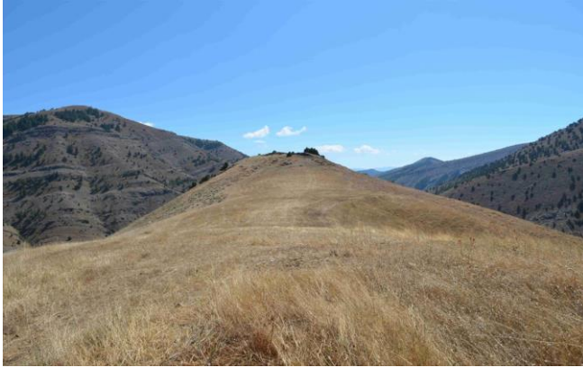
Resim 12. Kaleyeri/Kalecik Yerleşimi

Çalışma alanının kuzey doğusunu oluşturan ve Giresun-Gümüşhane sınırındaki Elmacık köyünde ki araştırmalarımız da ise Kaleyeri/Kalecik Yerleşmesi ile Topalaksığ Yerleşmesi tespit edilmiştir. Kaleyeri/Kalecik Yerleşmesi kuzey batı-güney doğu uzantılı bir tepe üstü yerleşmesidir.