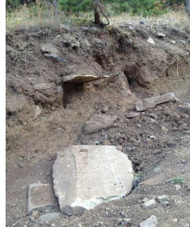
Resim 8. Salıncak Kaya Nekropolü - Basit Sanduka Mezar.

Han Tepesi Höyüğü'nün üzerinde Geç Kalkolitik Çağ'dan (GKÇ) Hellenistik Döneme kadar keramik parçaları bulunmaktadır. Han Tepesi Höyük ile İkiztepe ve Sivritepe Tümülüsleri belli bir hat üzerinde ve birbirine yürüme mesafesindedirler. Bu yerleşim birimi ve tümülüsler Hellenistik dönemde çağdaş gibi görünmektedir. İlçe merkezine yakın bu alanlardan sonra çalışmalarımız ilçenin kuzeybatısında bulunan Tepeköy köyü ve civarında devam etmiştir. Tepeköy köyünün, Salıncak Kaya Mevkii'nde erken dönem nekropolü olduğu düşünülen bir alan incelenmiştir. Salıncak Kaya nekropolü olarak isimlendirebileceğimiz bu alanda basit sanduka veya kasa mezar kalıntıları 14 gözlemlenmiştir. 15 Nekropol alanı bir yamaç üzerindedir ve yayla yolu nekropolü ikiye bölmektedir. Salıncak Kaya nekropolünün 200 m. güneydoğusunda ise Salıncak Kaya Yerleşimi olarak adlandırılan alan incelenmiştir. Bu alan Tepeköy köyü gölet yolunun hemen batısında doğal bir tepenin üstünde bulunan tepeüstü (kayalık) yerleşimidir. Yerleşimde az miktarda amorf keramik parçaları bulunmuş olup bu parçalar II. Binyıla tarihlenmiştir. Yerleşme Tepeköy köyü yaylasının kuş uçuşu 1 km doğusunda yer almaktadır. 16