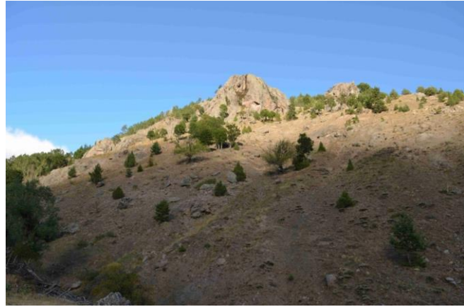
Resim 14. Topalaksığ Yerleşimi

Topalaksığ Yerleşmesi ise köyün 1 km kuzeyinde bulunan ve hemen batısından bir çay akan tepeüstü yerleşmesi olarak görülmektedir.