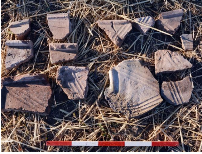
Resim 7. Han Tepesi Höyük- Kiremitlerin üstü parmakla yapılmış üçgen oluk bezemelidir.

Ayrıca II. binyıla ait ağız kısımları parmakla çentik bezemeli pithos (ağız) parçalarına rastlanmıştır. Höyük yüzeyinde öğütme taşları ile atölye artıkları da (cüruf) tespit edilmiştir.