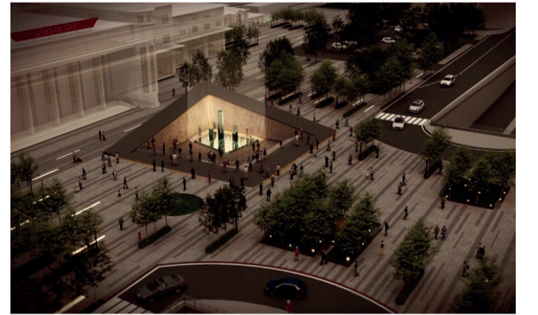
Anıt Meydanı ve Anma Yeri Uluslararası Fikir ve Tasarım Projesi Yarışması İKİNCİLİK ÖDÜLÜ

TMMOB tarafından düzenlenen projelerin değerlendirme konferansı ve sergisi 3 Mart 2020 tarihinde Mimarlar Odası'nda yapıldı. Yurt içinden ve yurt dışından projelerin katıldığı yarışmada, jüri değerlendirmesi 4'ü yurt dışından olmak üzere 11 akademisyen ve uzman tarafından gerçekleştirildi.