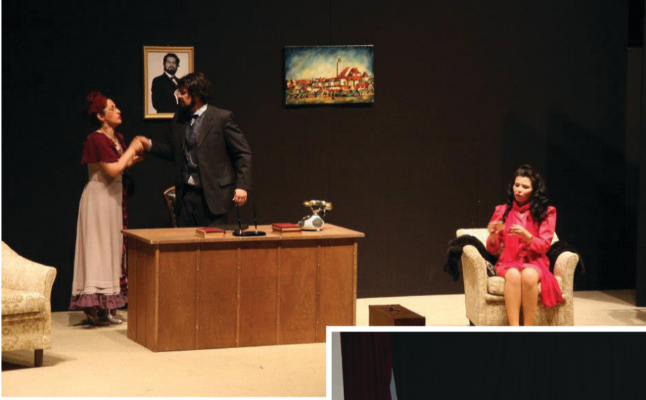
Anton Çehov Giresun Belediyesi Şehir Tiyatrosu