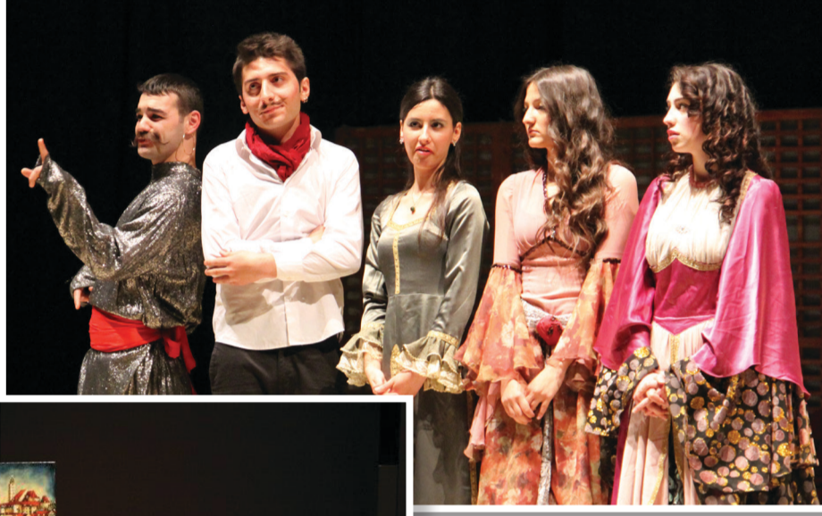
Kadınlık Bizde Kalsın Karadeniz Teknik Üniversitesi

Istanbul Efendisi , KTÜ Töre adlı oyunları sahneledi. Bir hafta boyunca izleyicileri hem eğlendiren hem de düşündürülen oyunlar sahnelenirken etkinlik sonunda oluşan ortak temenni hem üniversite öğrencilerinin tiyatrodan kopmamalarını sağlamak hem de tiyatronun güzelliğini herkese göstermek amacı ile bu tür etkinliklerin daha sık yapılmasıydı.