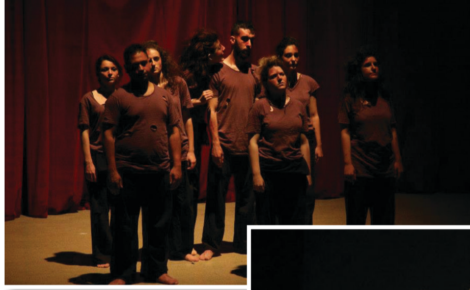
Ormanlardan Hemen Önceki Gece Galatasaray Üniversitesi

Genel olarak bir işe başlayacaksanız yapayım da olsun dememeli, hakkını sonuna kadar vermeli ve tüm benliğiniz ile kendinizi orada hissetmelisiniz. Kompleksli olmamalı bir şeyleri burada bırakmalı ve buradan bir şeyler alıp ayrılmalısınız.