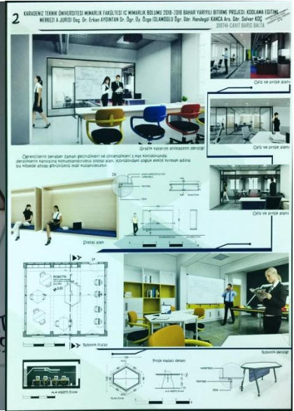
Cavit Barış BALTA