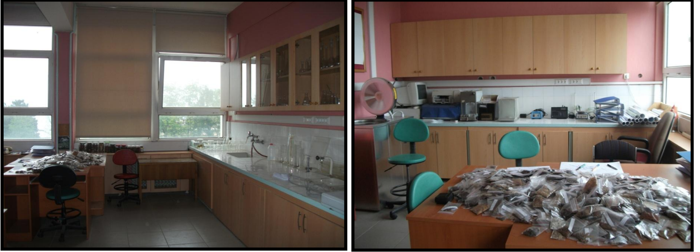
Şekil 1: Genetik Ve Doku Kültürü Laboratuarından Genel Görünüm