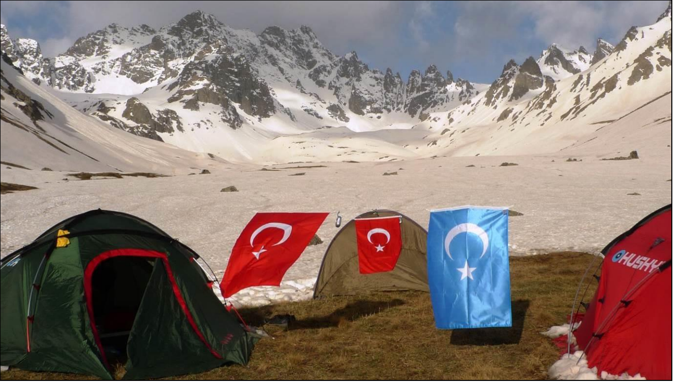
YUVA YAPTIK DAĞLARA...