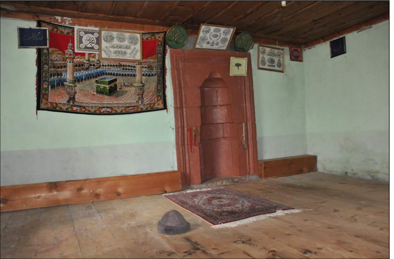
İBRAHİM AMCASIZ MESCİT...