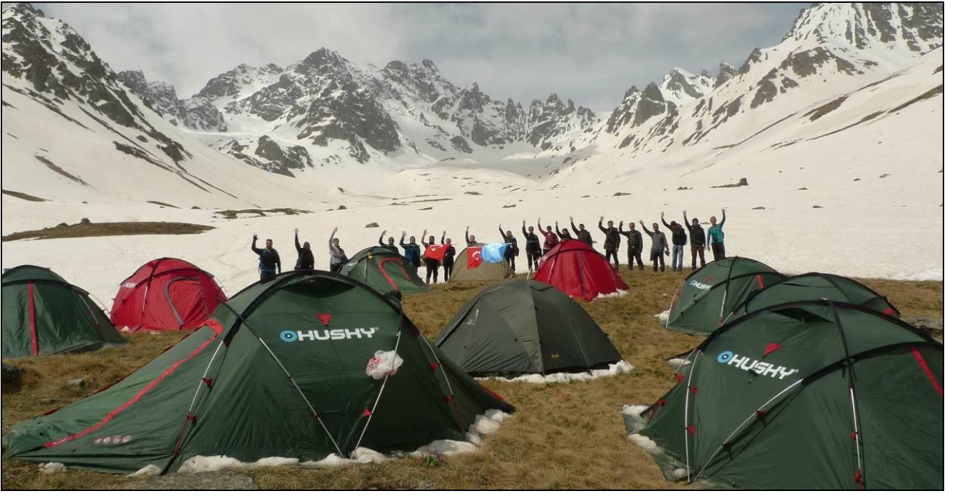
ÇADIRLARI DÜBE DÜZÜNDE BULDUĞUMUZ BİR AÇIKLIĞA KONDURDUK...