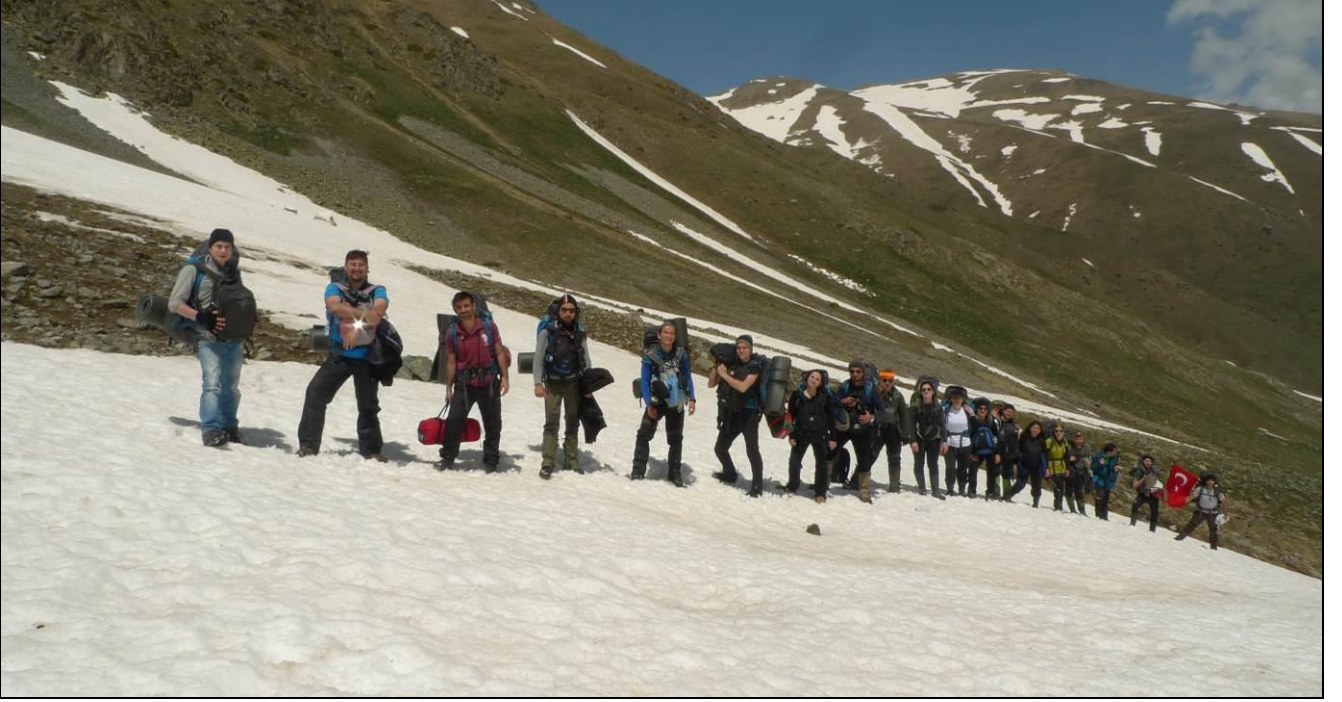
GENÇLERLE GURUR DUYDUK...