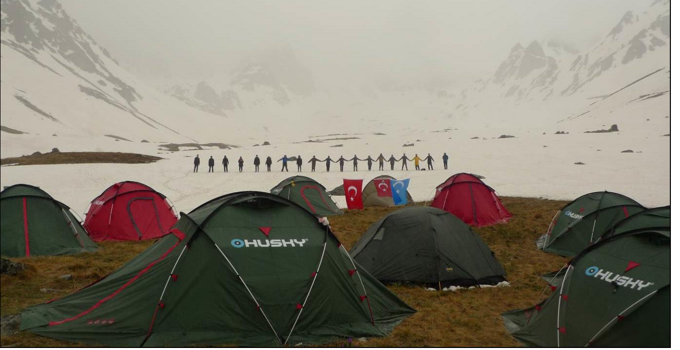
KAŞGAR DAĞLARI... DÜBE DÜZÜNDEYİZ...