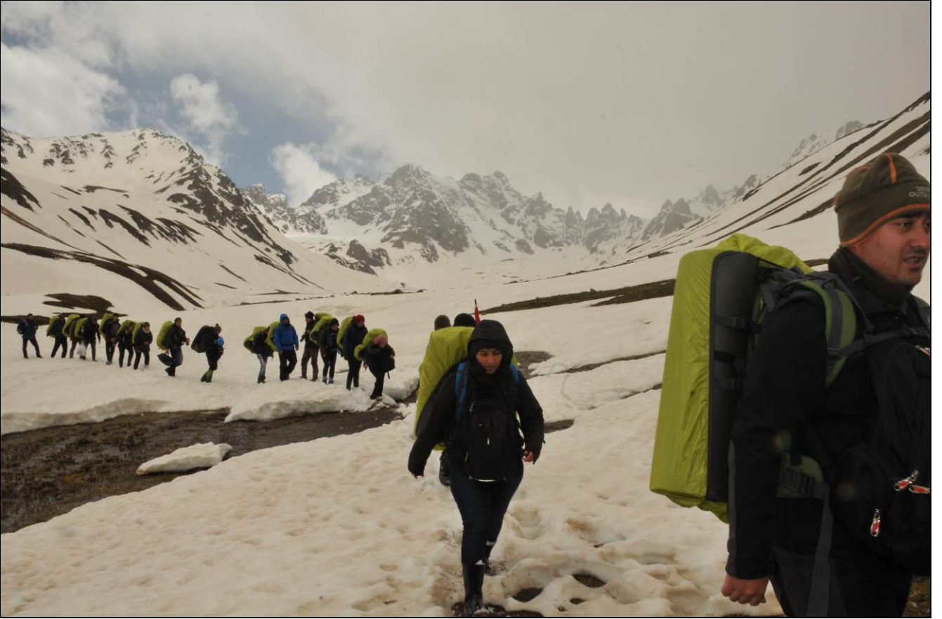
TİMİN DAYANIKLILIĞI İYİ...