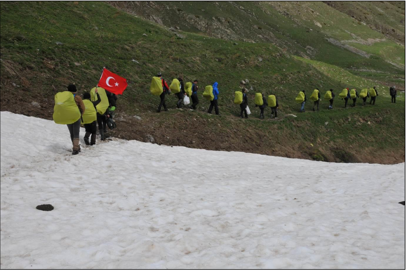
YİNE GELMEK DİLEĞİYLE...