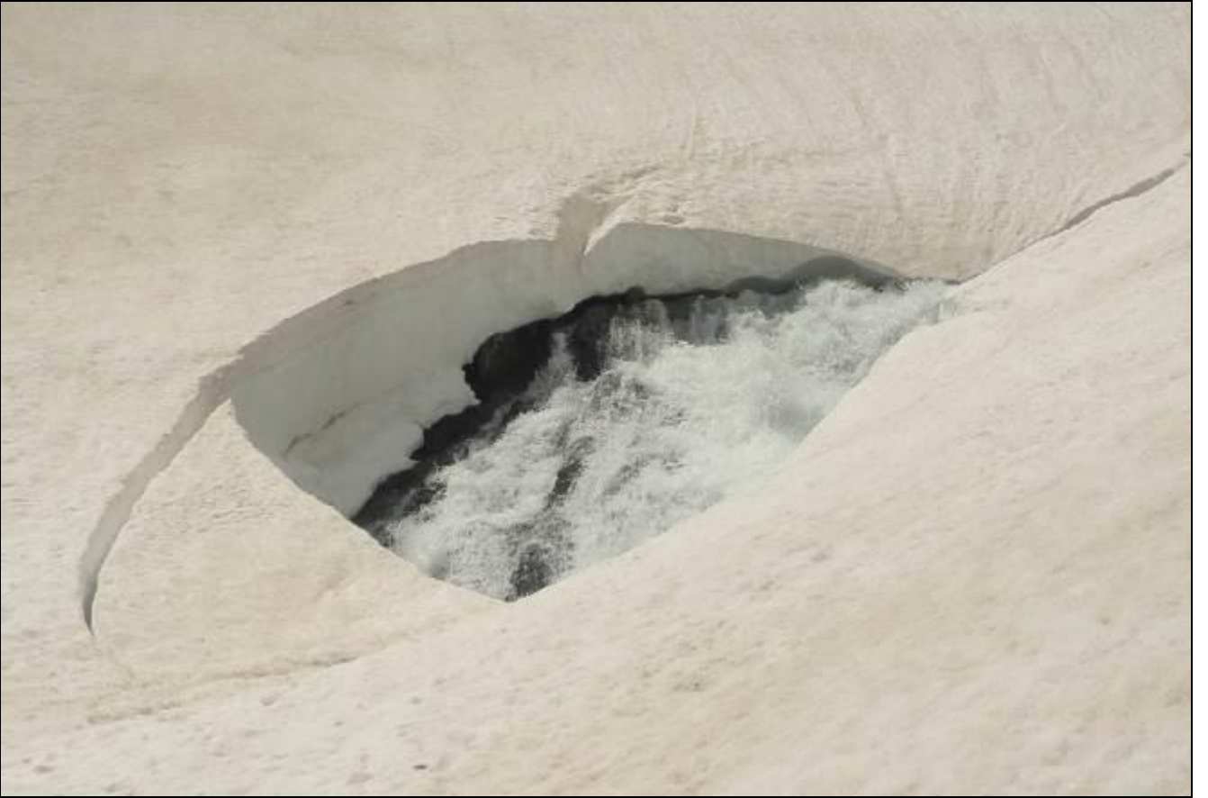
KARLAR ERİYOR... DERELER AÇIĞA ÇIKIYOR...