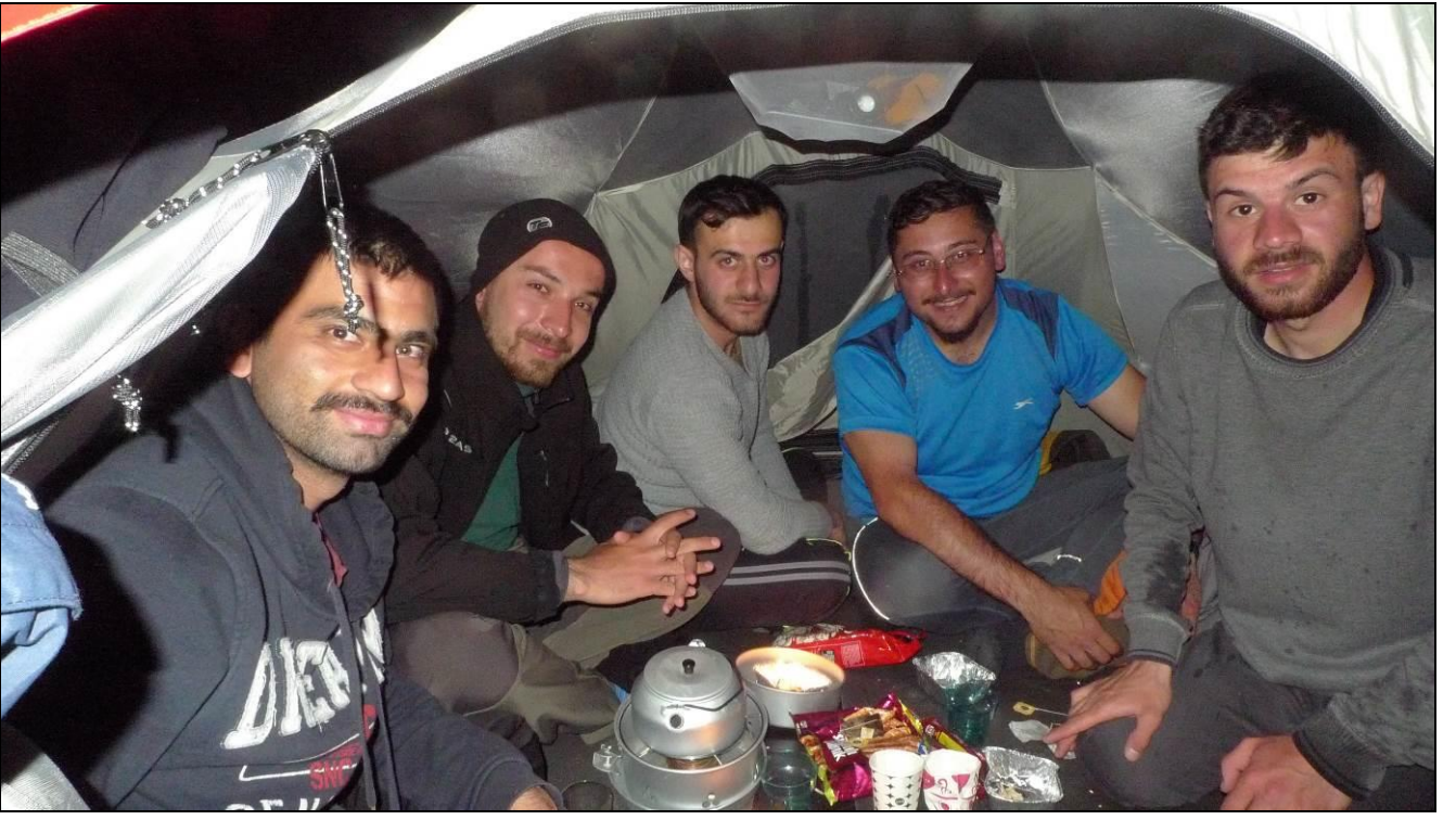
BAŐKAN EMRENİN ADIR GECERİ SEKİZ KİŐİLİK...