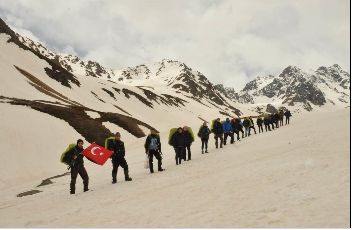
PARS TİMİ HAREKET HALİNDE...