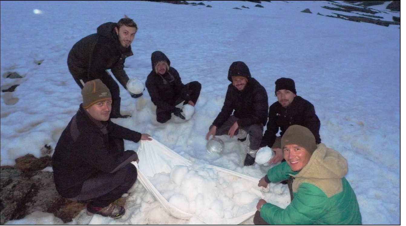
ADIRLARIN ETEKLERİNİ KARLAYINCA RÜZGAR AZALDI, SICAKLIK ARTTI...