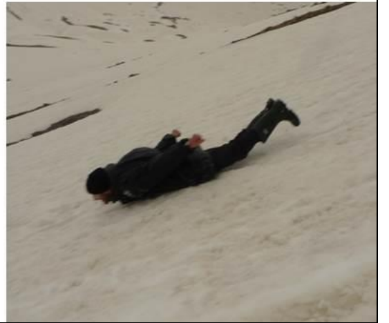
KIZI ERKEĞİ HERKES BU ANI BEKLİYORMUŞ... GÜZERGAHIN GÜVENLİSİNİ BULUNCA UÇTUK...