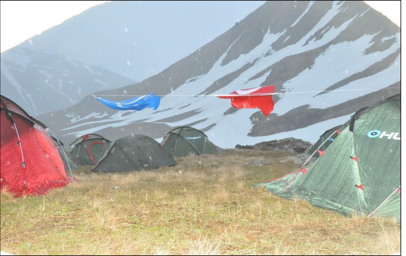
YAĞMUR, DOLU... SOĞUK AMA YAZ GELİYOR...