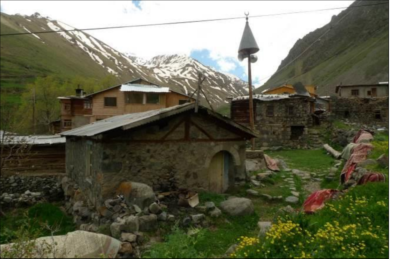
YILLAR ÖNCE ŞAĞDAN HOCAMIZIN İLK GECESİNİ GEÇİRDİĞİ MESCİT VE BİTİŞİĞİNDEKİ ODA YENİLENECEKMİŞ... BU HALİNİ SON KEZ ÇEKMEK İSTEDİK...