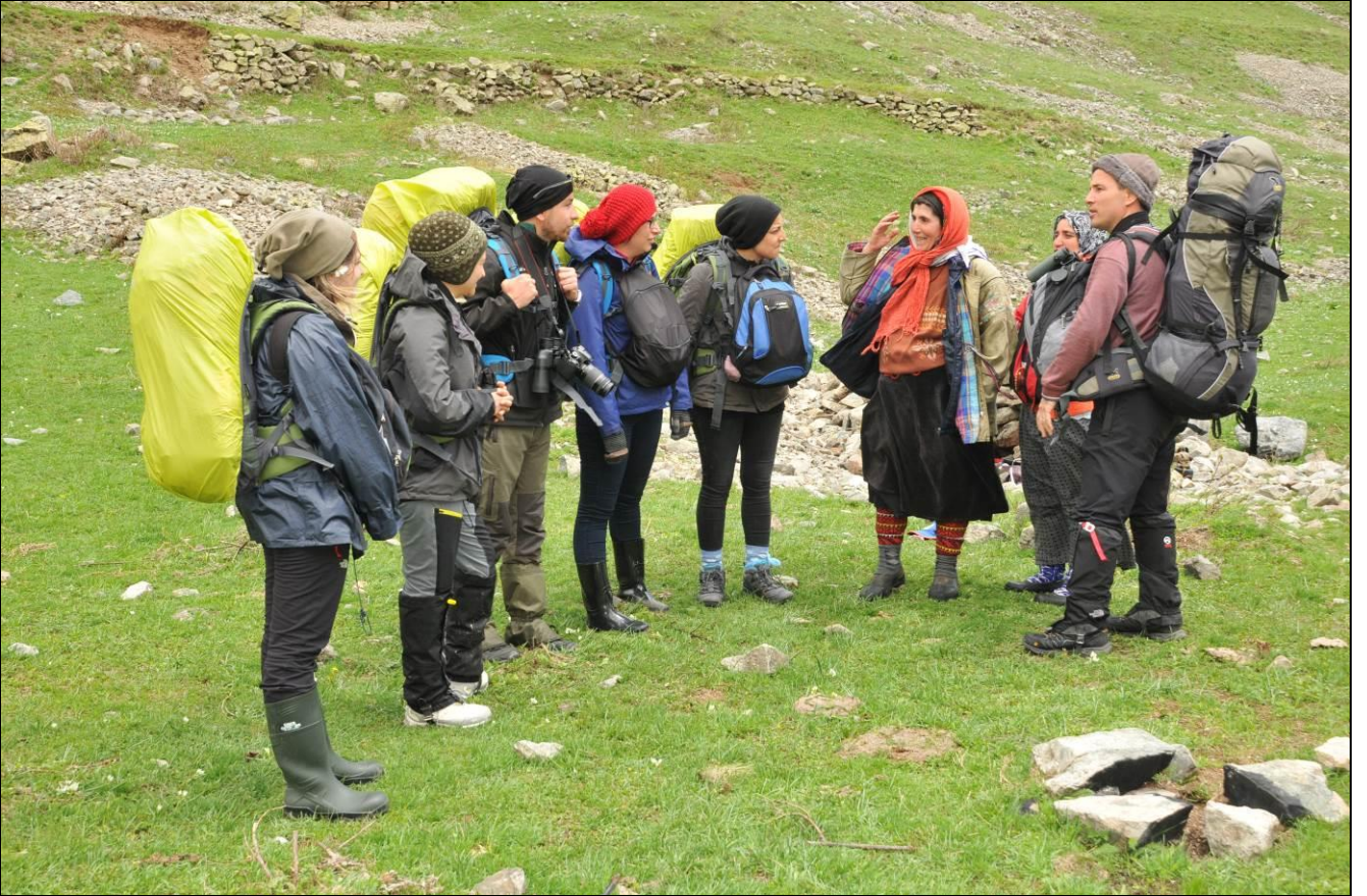
BUGÜN ÇOBANLIK NÖBETİ HANIMLARDA...