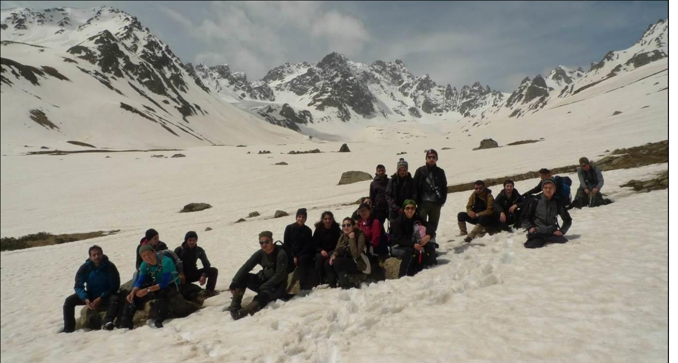
PARS TİMİ SOLUKLANIYOR...