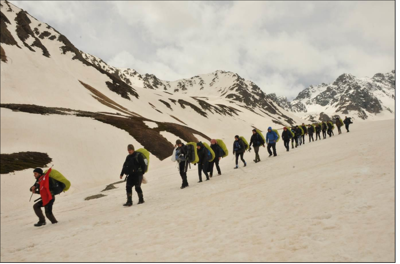
YAĞMUR GELİYOR, HIZLA İNİYORUZ...