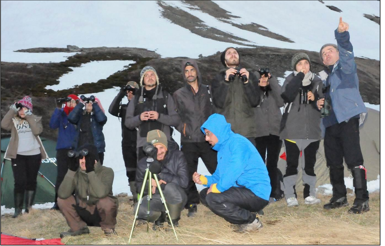
ÇADIRDAN UR KEKLİK, DAĞ HOROZU, SAKALLI AKBABA, KAYA KARTALI, ÇENGEL BOYNUZLU DAĞ KEÇİSİ (KARA KEÇİ, KARA AV), TİLKİ VE AYI GÖZLEMEK... DAHA NE OLSUN...