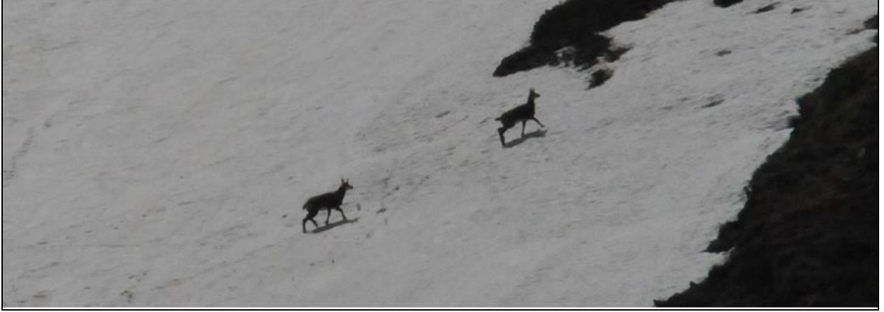
YOL BOYU BİZLERİ YALNIZ BIRAKMAYAN ÇENGEL BOYNUZLU DAĞ KEÇİLERİNDEN BAZILARI...