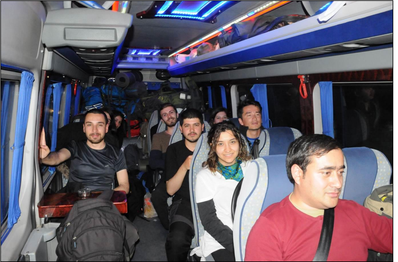
İKİ MINİBÜSE DOLUŞTUK...