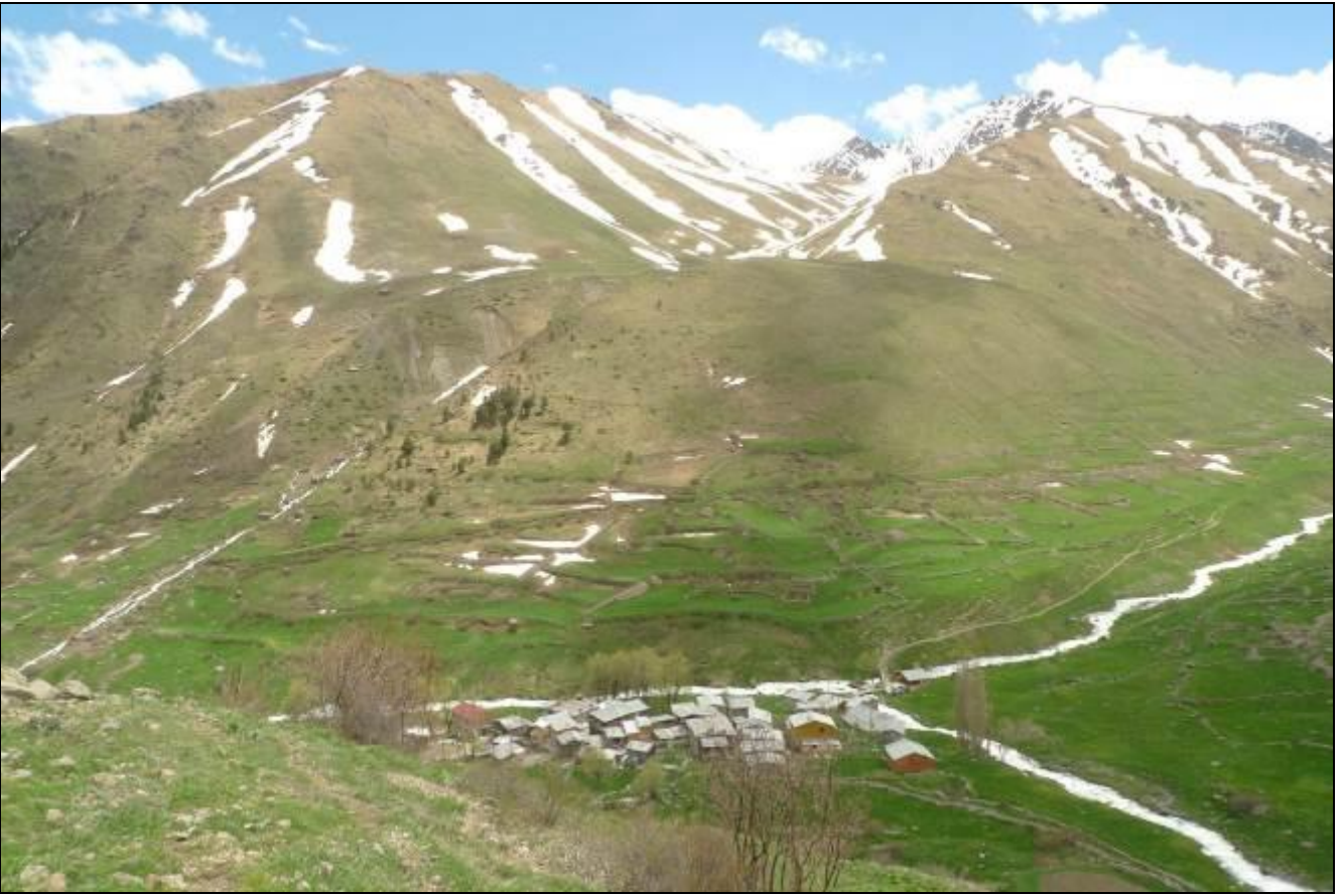
ARTIK OLGUNLARA AZ KALDI...