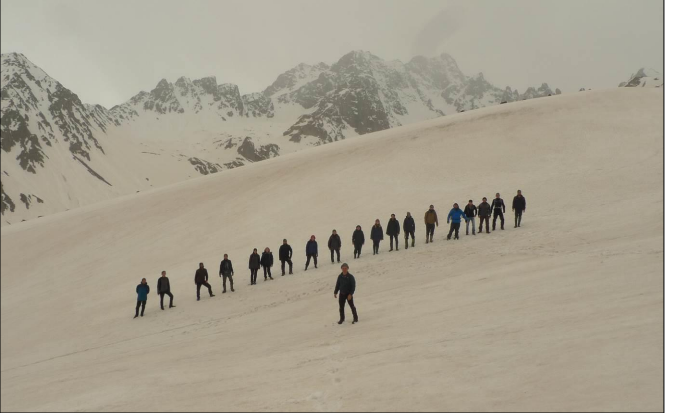
BU GENÇLERE HELAL OLSUN...