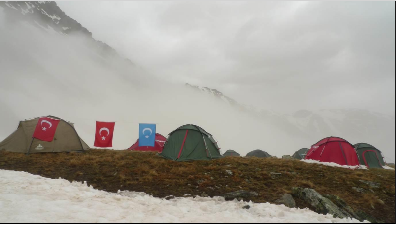
ÇADIRLAR DUMAN ALTINDA...