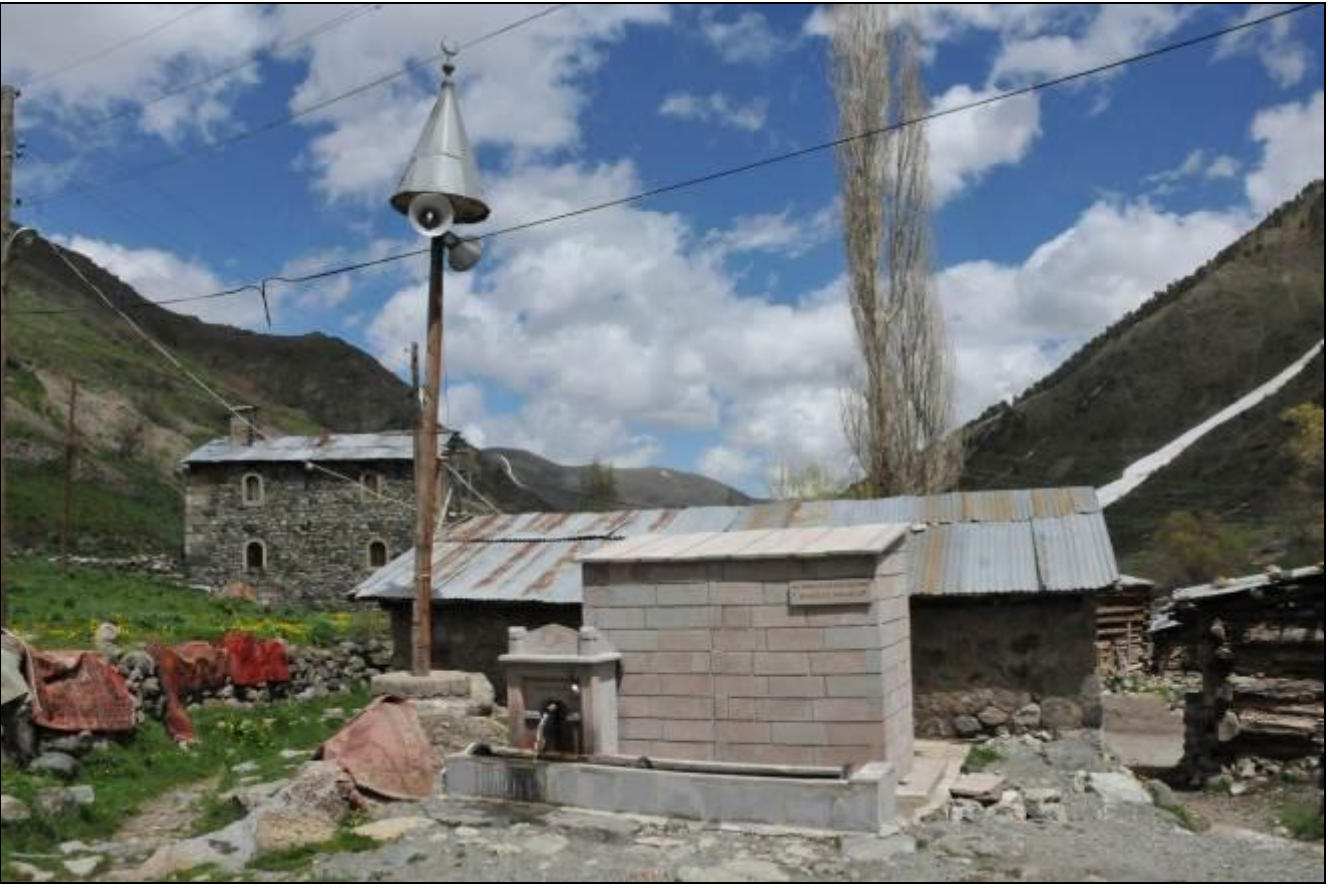
ÇEŞME, GURNA VE YALAK YENİLENMİŞ, TUVALET YERİ DEĞİŞMİŞ VE YENİLENMİŞ...