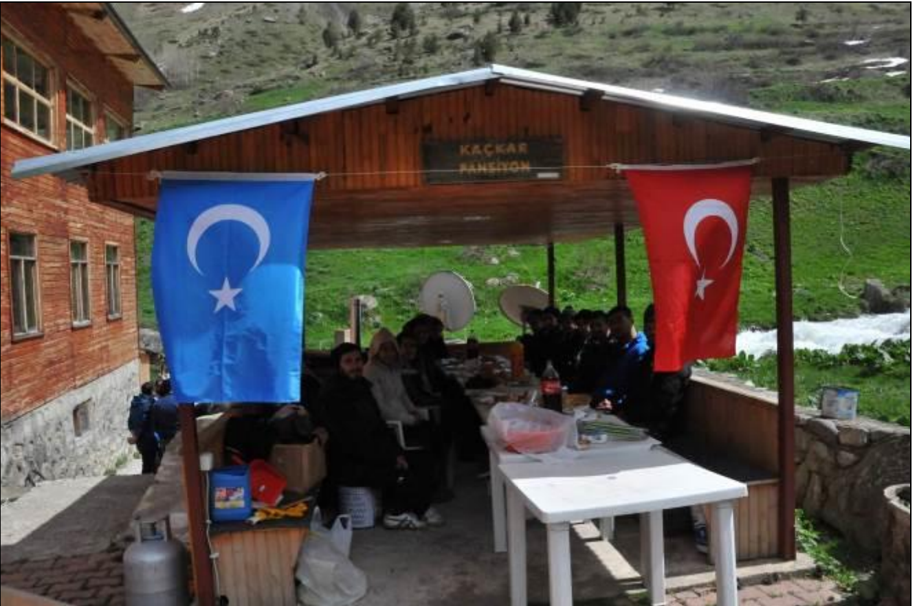
ANLAŞTIĞIMIZ SAATTE ŞOFÖRLERİMİZ MANGALI YAKTI...