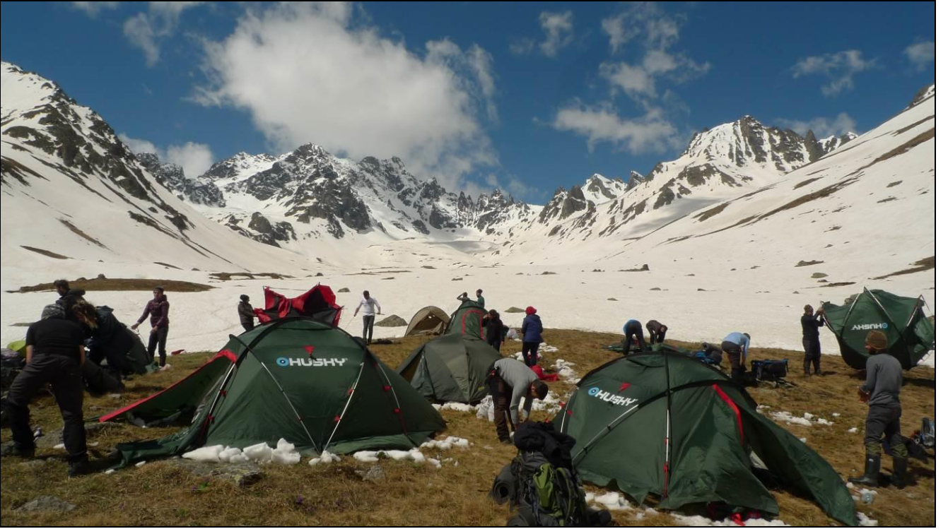
BAĞ BOZUMU... YAĞMURDAN FIRSAT BULUNCA ÇADIRLARI KURUTTUK... ACİLEN TOPARLANIYORUZ...