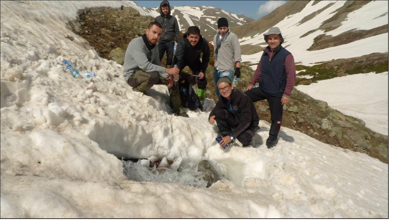
SUYU KAYNAĐINDAN İÇMEK...