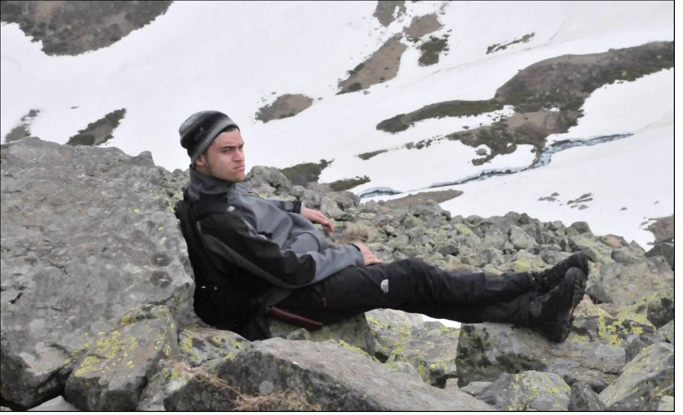
KAAN... NAMI DİĞER HAKEM...