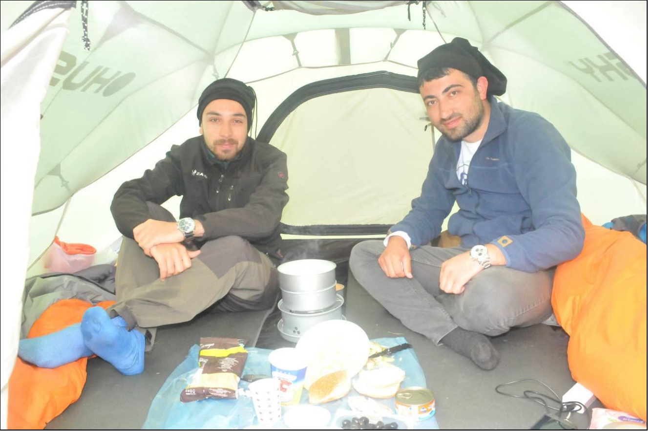
ÖZEN VE KARADAĞIN ÇADIR...