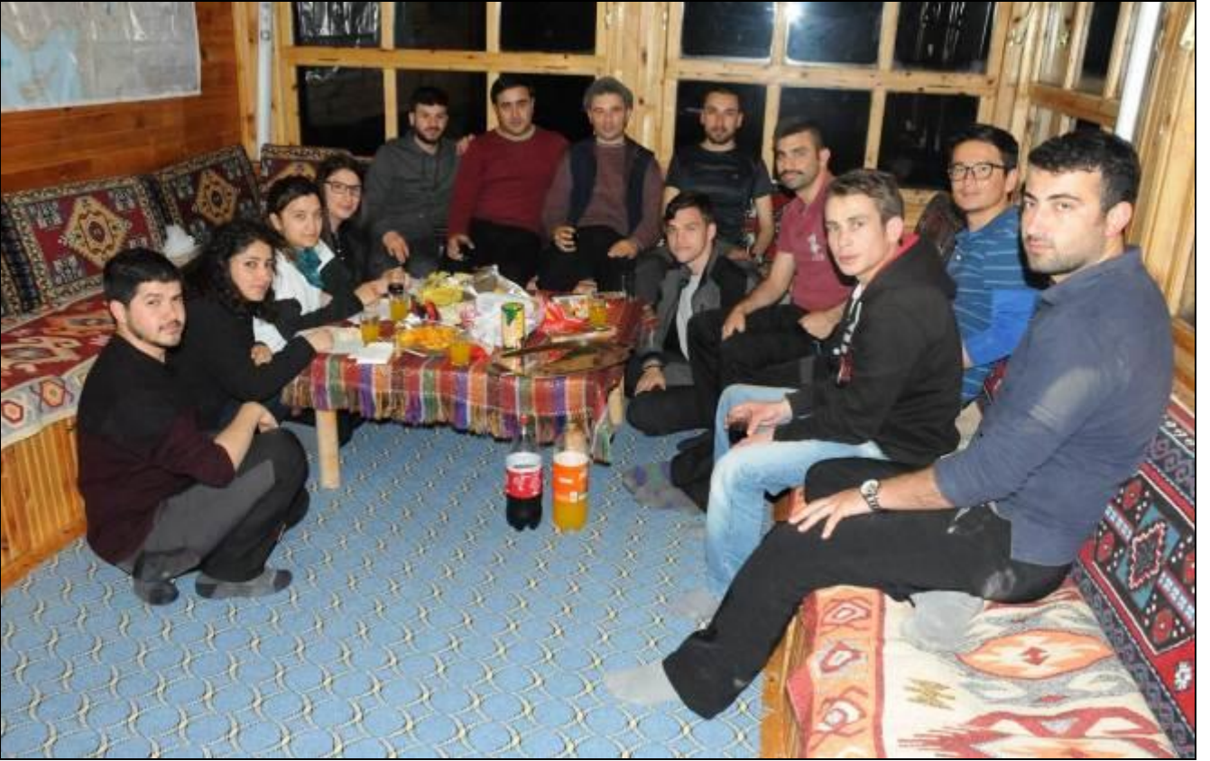
YAYLALAR KÖYÜ, OLGUNLAR MAHALLESİNDE KAŞGAR PANSİYONDAYIZ...