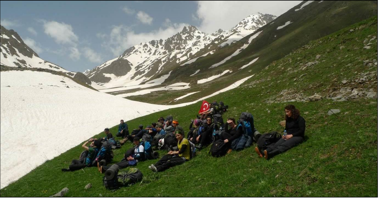
BUNLAR İYİ ZAMANLARIMIZ...