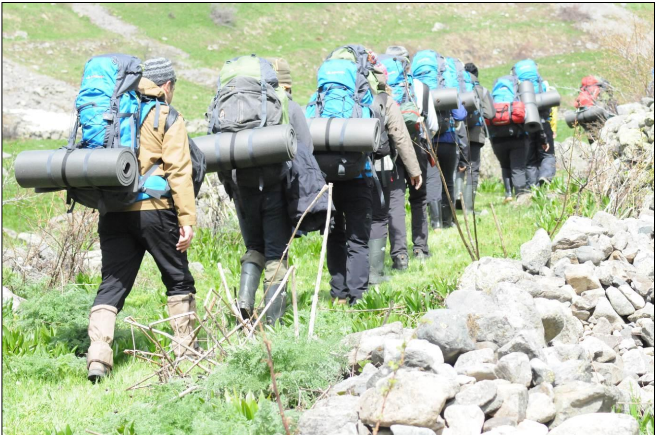
ARTIK MOTOR GÜCÜ YOK... HEP YUKARI, YOLA DEVAM...