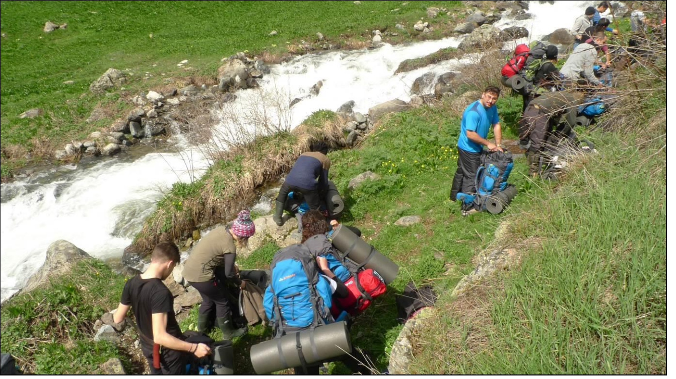
İLK DURAKLAMA... TERLEDİK... BİRŞEYLERİ ÇIKARMAYA BAŞLADIK...