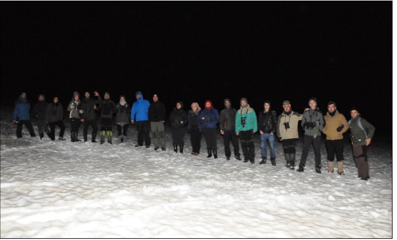
PARS TİMİ GECE EĞİTİMİNDE...