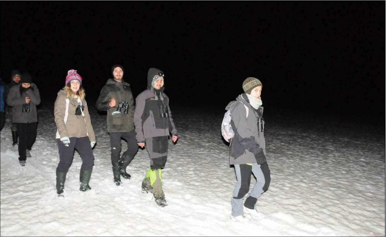
PARS TİMİ GECE EĞİTİMİNDEN DÖNERKEN ÇOK MUTLU... EEE... ÇORBALAR, ÇAYLAR İÇİLECEK, DİNLENİLECEK...