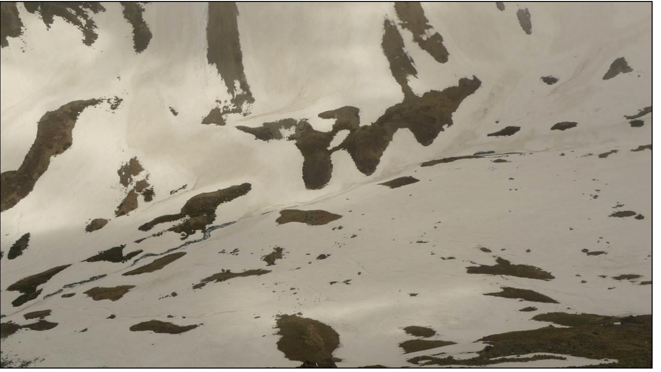
ÇADIRLAR TAM ORTADAKİ BOŞLUKTA...