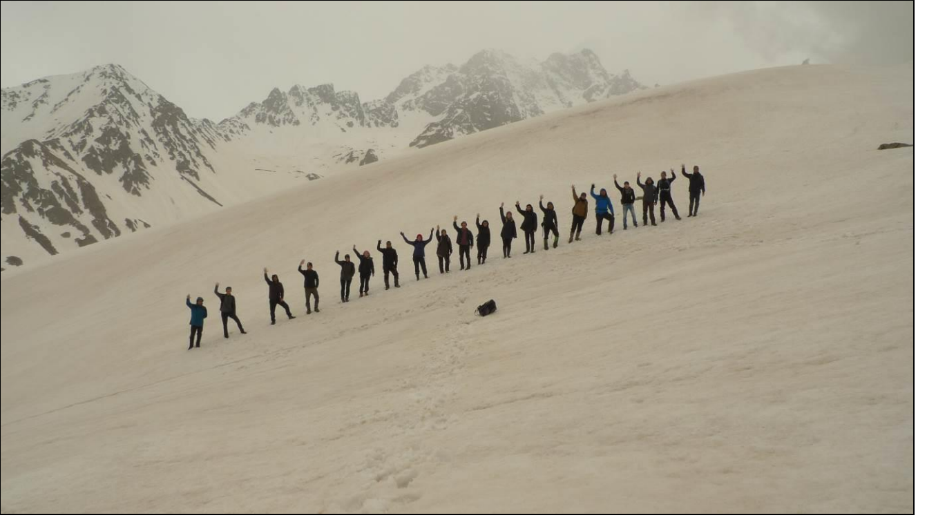
PARS TİMİ - 2016 MEZUN ADAYLARI... ARKADA, KAŞGAR DORUĞU...